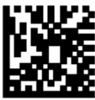
Установка заводских настроек (EC)

Для настройки сканера последовательно просканируйте приведённые ниже штрих–коды.